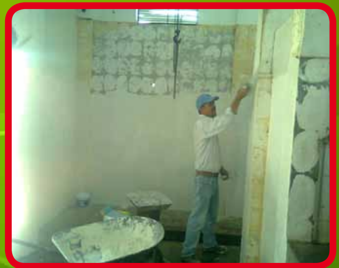
Demolición de azulejo y aplicación de pulido en muros