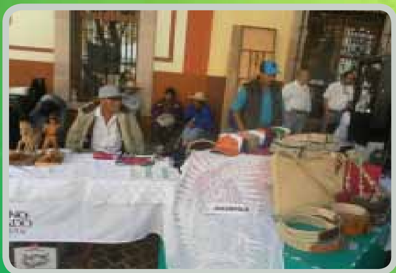
Evento del Día del Artesano en la Ciudad de Zacatecas

Trabajamos directamente con la Subsecretaría de Desarrollo Artesanal de Zacatecas y en coordinación con los municipios de Apozol, Mezquital del Oro, Moyahua de Estrada, Joaquín Amaro y Jalpa, para instalar la Tienda de Artesanías “Xochipillan” situada frente a Palacio Municipal, donde los artesanos traen sus productos a vender, sin el cobro de comisión alguna.