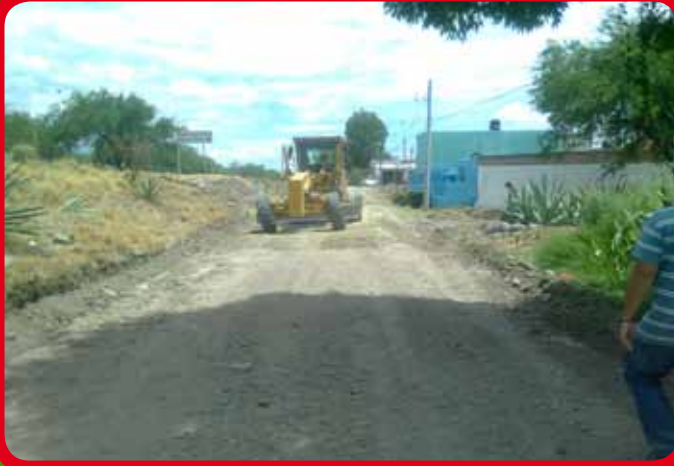
Rehabilitación de calle paralela a la Carretera Guadalajara - Saltillo entre calle principal y Arroyo del Jaral