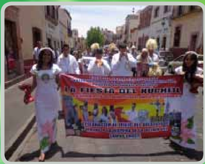
Festival Cultural 2014

Compañía de Danza Contemporanea de León, Guanajuato. Epopeya Zacatecana de Guadalupe, Zacatecas, además de obras presentadas por grupos de la región.