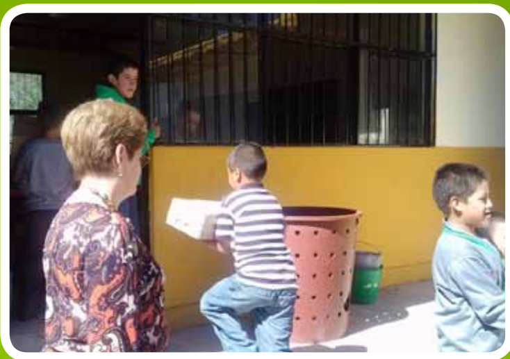
Primaria Plan de Ayala, Pueblo Viejo.

Contamos con una dotación para atender diariamente a 650 niños registrados en la mayoría de los Preescolares y Primarias de nuestro municipio.