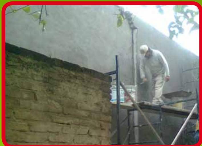
Pintura y enjarre de muros en la Cocina Popular