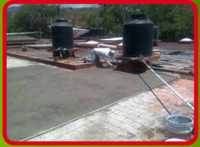
Reparación e impermeabilización de azotea