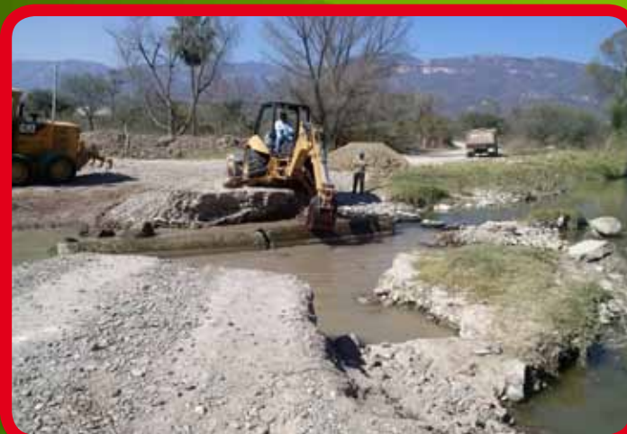
Construcción de paso temporal con tubería para comunicar el Fraccionamiento El Paraíso - Guadalupe Victoria