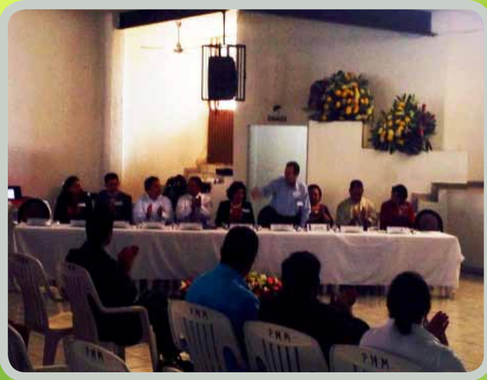
Primer Taller de Formación del Programa de “Desarrollo Turístico Región Cañón de Juchipila”