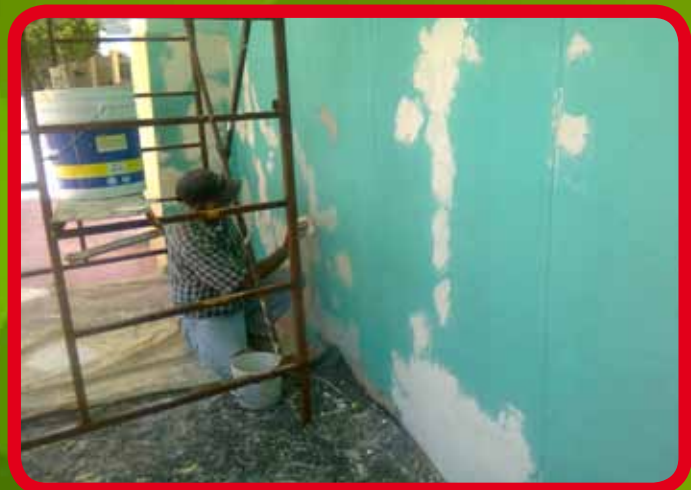
Aplicación de pintura en la Escuela Primaria “Gral. Enrique Estrada”.

Se ha apoyado con mano de obra a diferentes Instituciones Educativas: