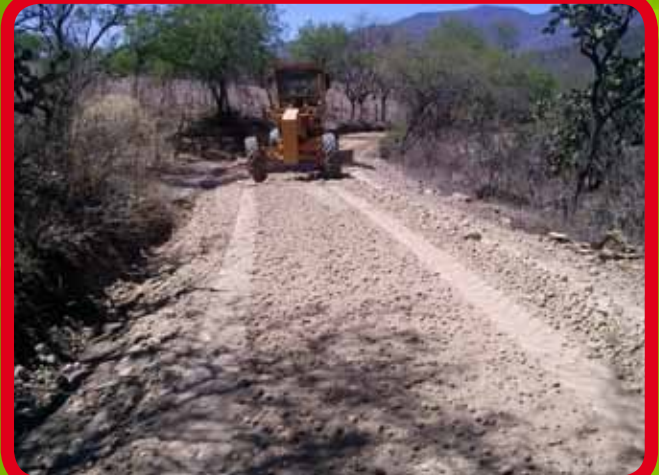
Rehabilitación de camino que se encuentra a espaldas del panteón de la Comunidad de Contitlán