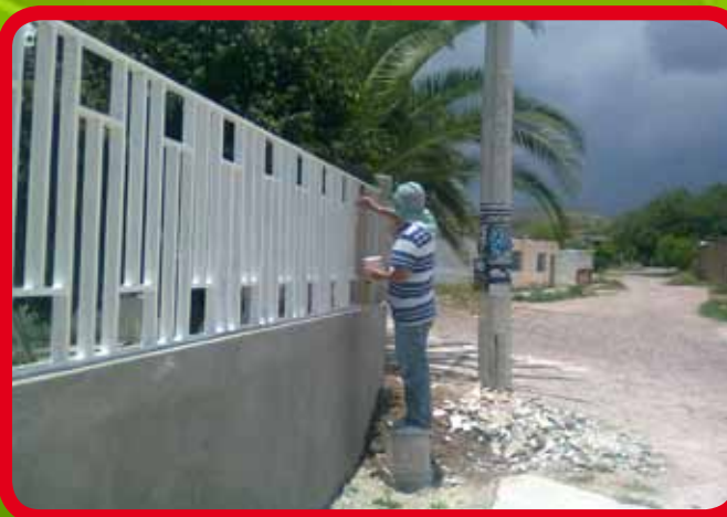
Rehabilitación de enjarre, resanes para aplicación de pintura en muros y herrería, de la misma manera se apoyo con instalación eléctrica en Jardín de Niños “Candelario Huízar”