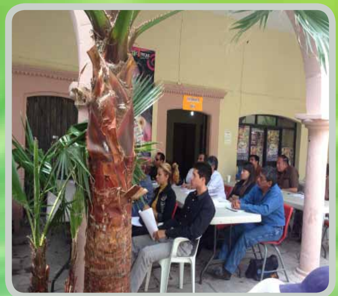
Reunión del Programa PACMyC