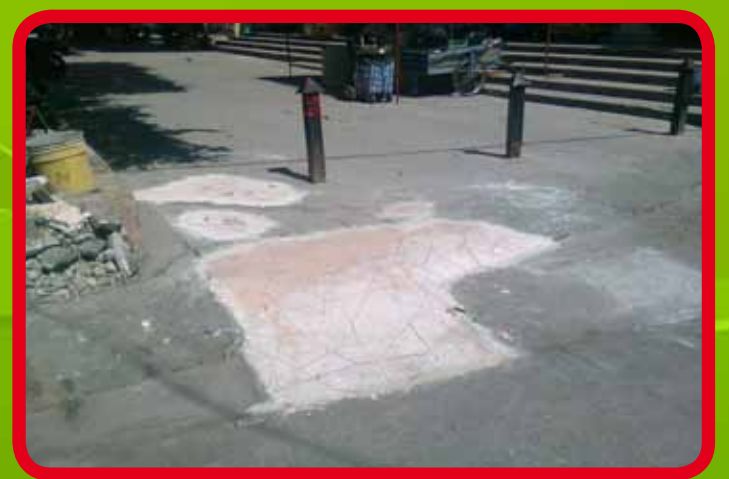
Rehabilitación de piso en área peatonal.