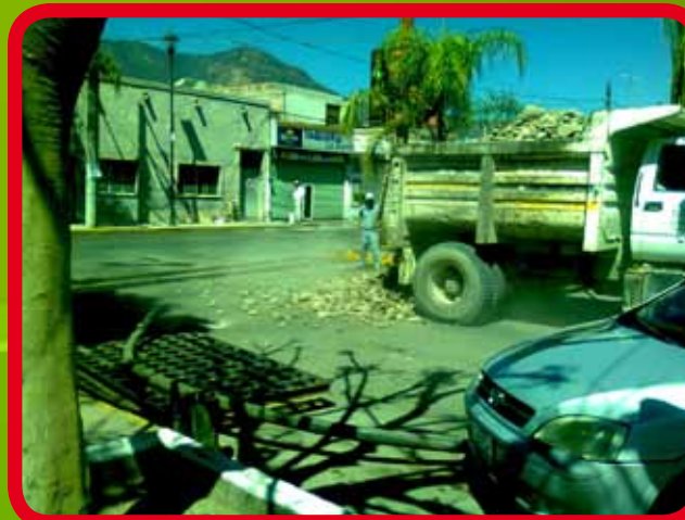
Adecuación en bocas de tormenta para desalojo de drenaje pluvial.