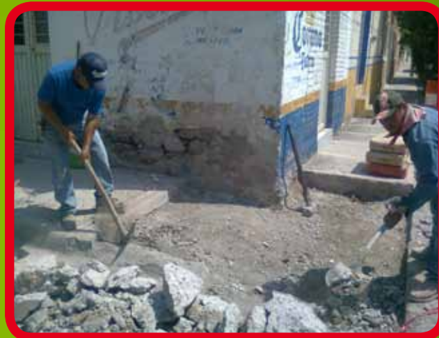
Construcción de rampa para discapacitados en Calle Ramón Corona esquina con Calle González Ortega