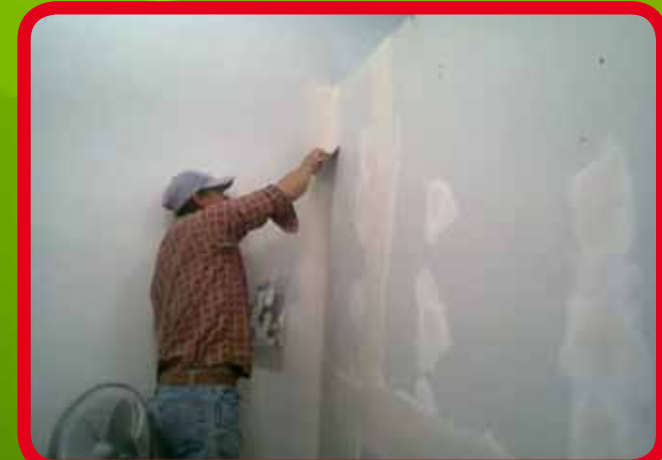
Construcción de muro divisorio de tabla roca para habilitar oficina del Juzgado Comunitario