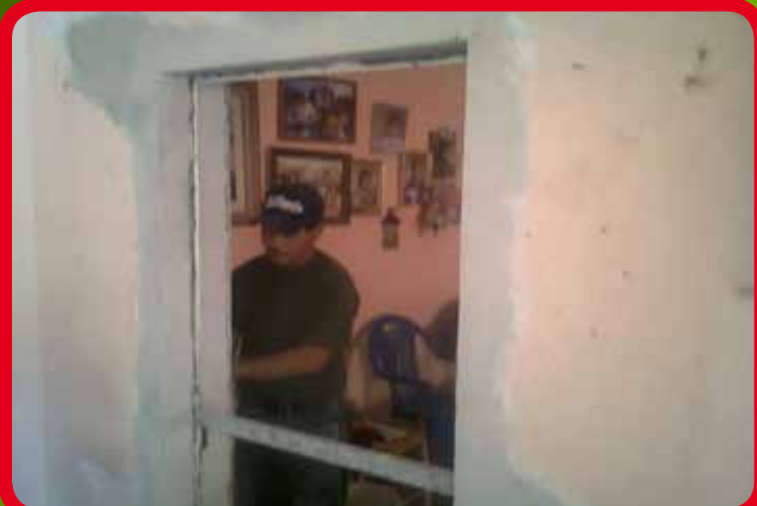
Apoyo de enjarres en vivienda por causas diversas