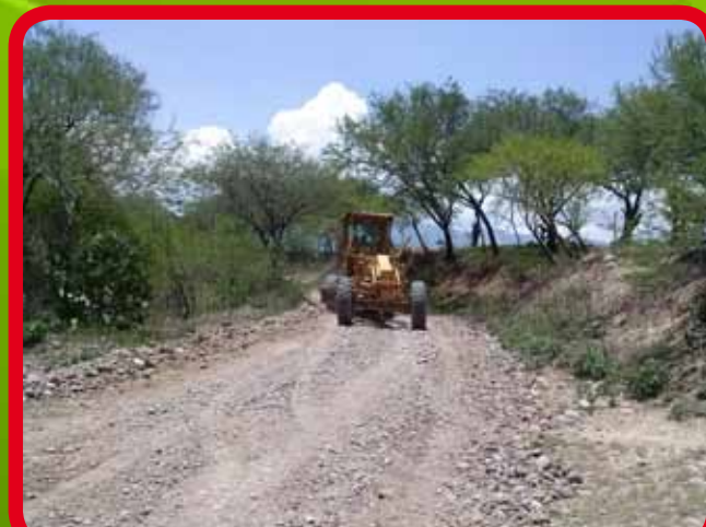
Rehabilitación de camino rural hacia el pozo de la Comunidad de Amoxóchitl