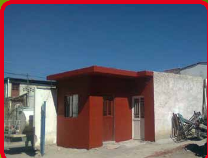
Construcción de caseta de vigilancia en el Parque Vehicular