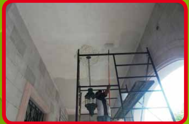
Pulido de bóveda, aplicación de pintura e instalación de molduras en Palacio Municipal.