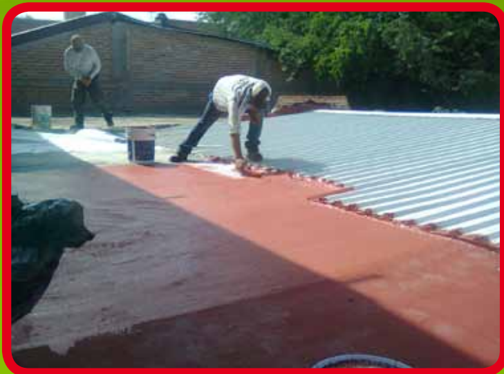
Reparación de techumbre de lámina e impermeabilización de techo en salón de canto en el Jardín de Niños “Genaro Codina”