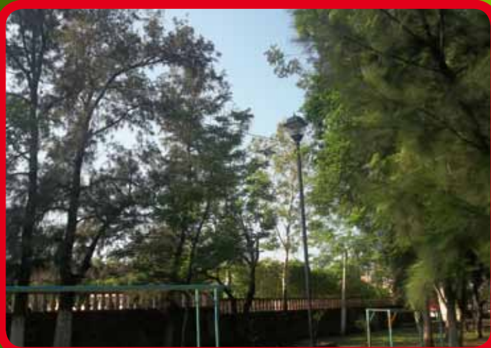
Suministro e instalación del alumbrado público de los andadores en la zona Oriente