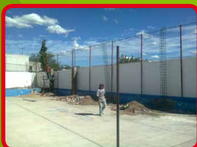
Apoyo para la construcción de zapatas y columnas para construcción de domo en la Escuela Primaria “Guadalupe Victoria”