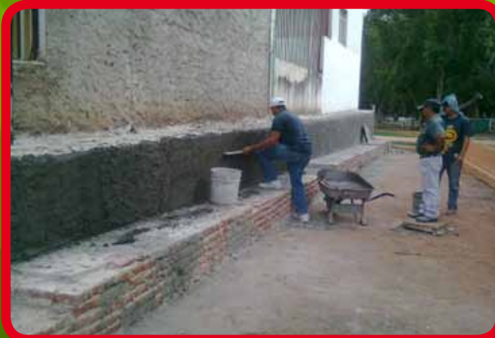
Rehabilitación y enjarre de gradas acceso Sur Poniente