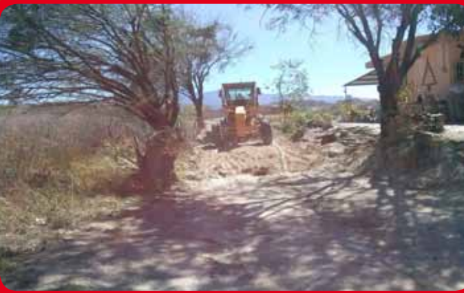
Rehabilitación de calles en el Fraccionamiento Santa Cecilia con tepetate