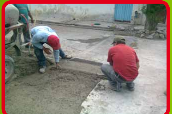
Construcción de topes en calle Prolongación García Salinas