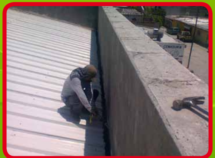
Mantenimiento de canaletas de desagüe de agua pluvial en auditorio