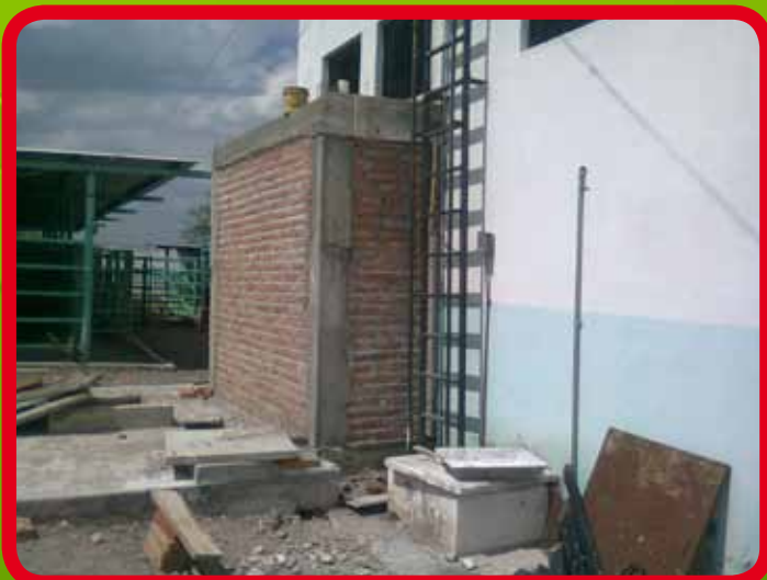
Demolición y ampliación de muros en área de degüello.