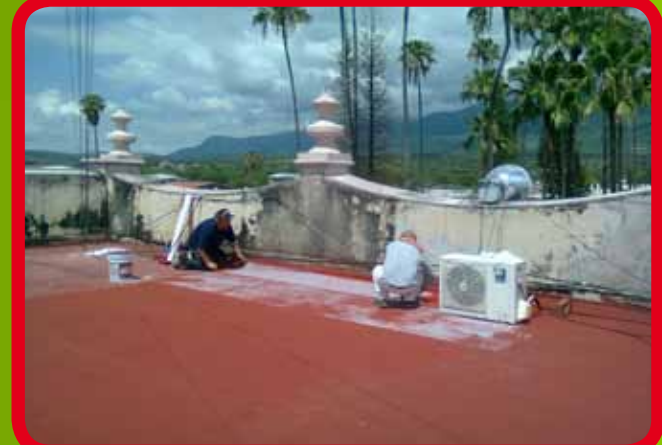
Limpieza de fachada e impermeabilización de azotea en el Palacio Municipal