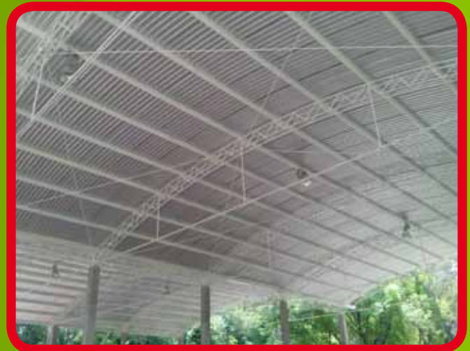
Reubicación del alumbrado para servicio de las canchas techadas de básquetbol