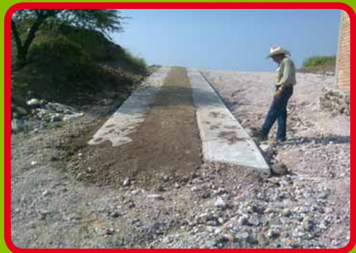
Construcción de pavimento ecológico en el panteón de la Mezquitera Sur