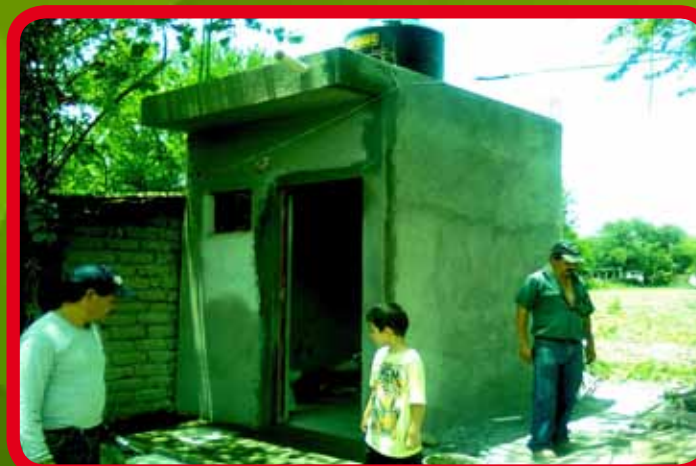
Construcción de baño en vivienda de la Comunidad de La Rinconada