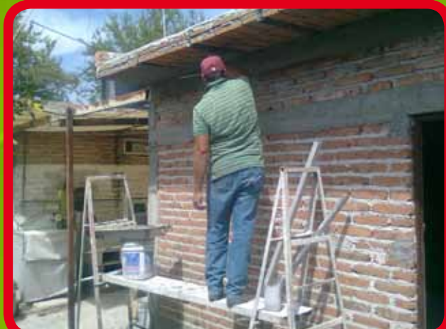
Construcción de cuarto de diálisis con instalación hidráulica para lavamanos en la Comunidad de la Mezquitera Sur