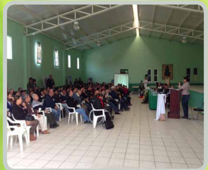
Segundo Taller de Planeación Estratégica del Programa de “Desarrollo Turístico del Cañón de Juchipila”.

En la difusión y promoción de nuestro Municipio como destino turístico, se ha implementado lo siguiente: