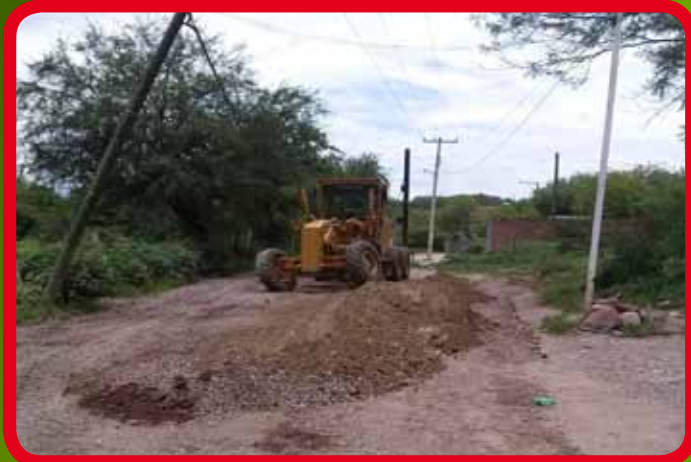
Rehabilitación de camino La Quinta hacia el Fraccionamiento Juchipila y Guadalupe Victoria