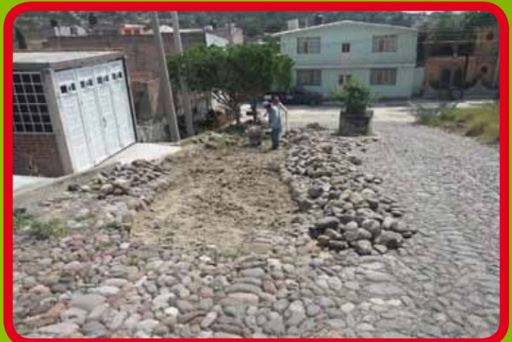
Rehabilitación de empedrado en calle Diamante