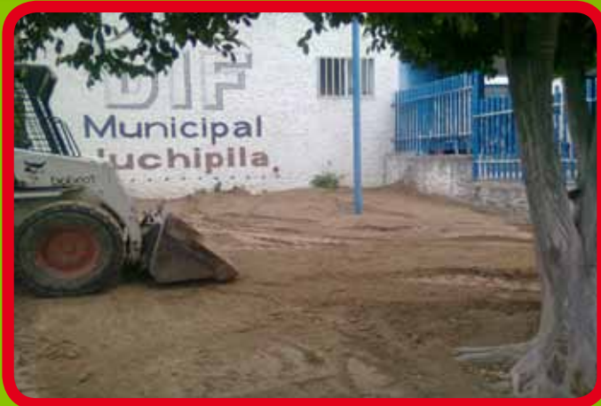
Colocación de tierra lama para huerto familiar