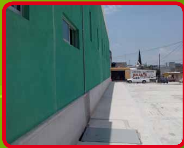
Interconexión de bomba sumergible para el suministro de agua potable.