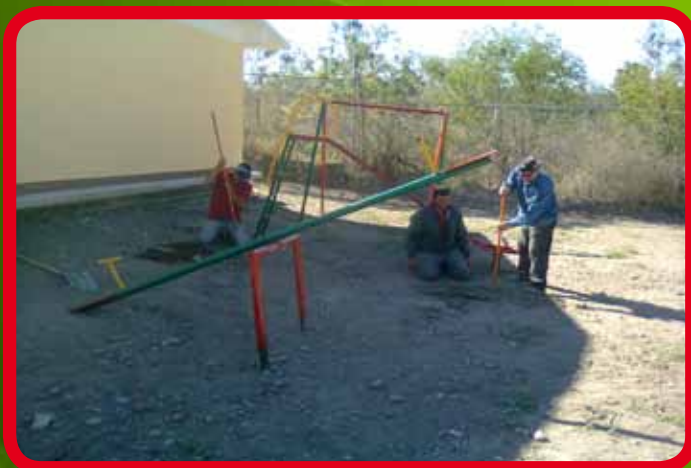
Instalación de juegos infantiles en Jardín de Niños “Eulalia Guzmán Barrón”