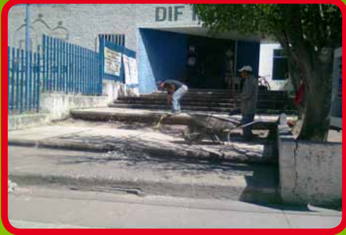
Rehabilitación de huella en escalones de ingreso al edificio