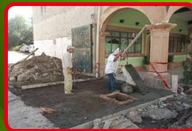
Construcción de rampa en acceso al estacionamiento